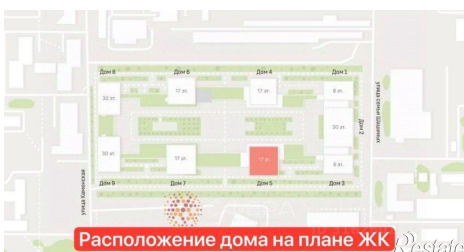
Расположение дома на плане ЖК