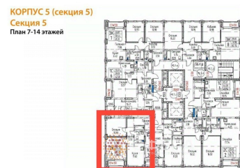
На поэтажном плане